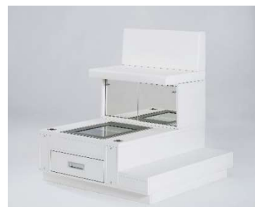
Compact mit Scannereinbau,